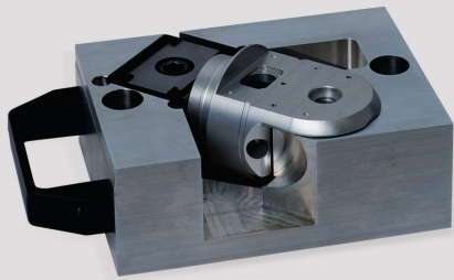
③ Teil einlegen Insert part